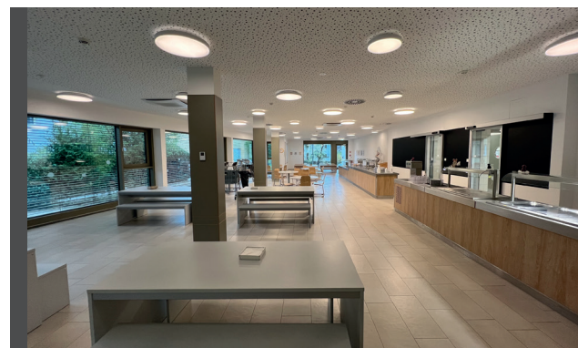
Le restaurant cycle 2-4

Les études surveillées durent 45 minutes. Les enfants qui n'ont pas de devoirs seront amenés à réviser leurs cours ou à faire des exercices complémentaires de lecture ou d'écriture.