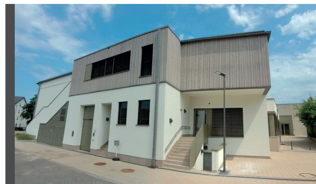
La Maison Relais Lintgen

Notre structure a ouvert ses portes le 15 septembre 2009. Actuellement, le SEAS peut accueillir 316 enfants entre 3 et 12 ans.