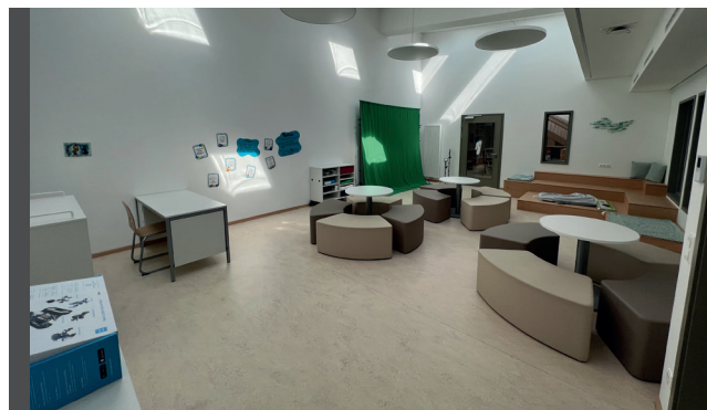
La salle de médias

Un partenariat entre l'école fondamentale, la commune et le Service national de la jeunesse a été établi en 2017 pour faire avancer ce projet. La commune nous a mis à disposition l'ancien bâtiment de la poste, entièrement rénové depuis.